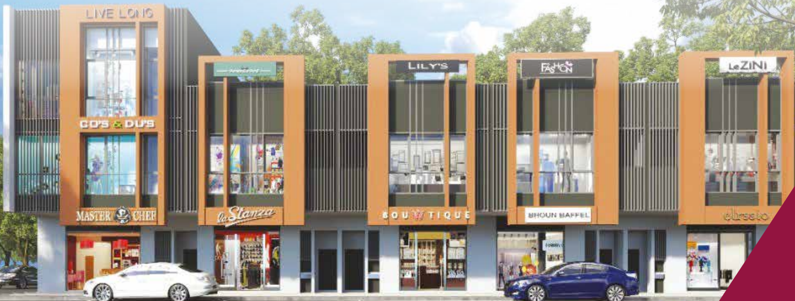
Gambaran pelukis 画家构想图