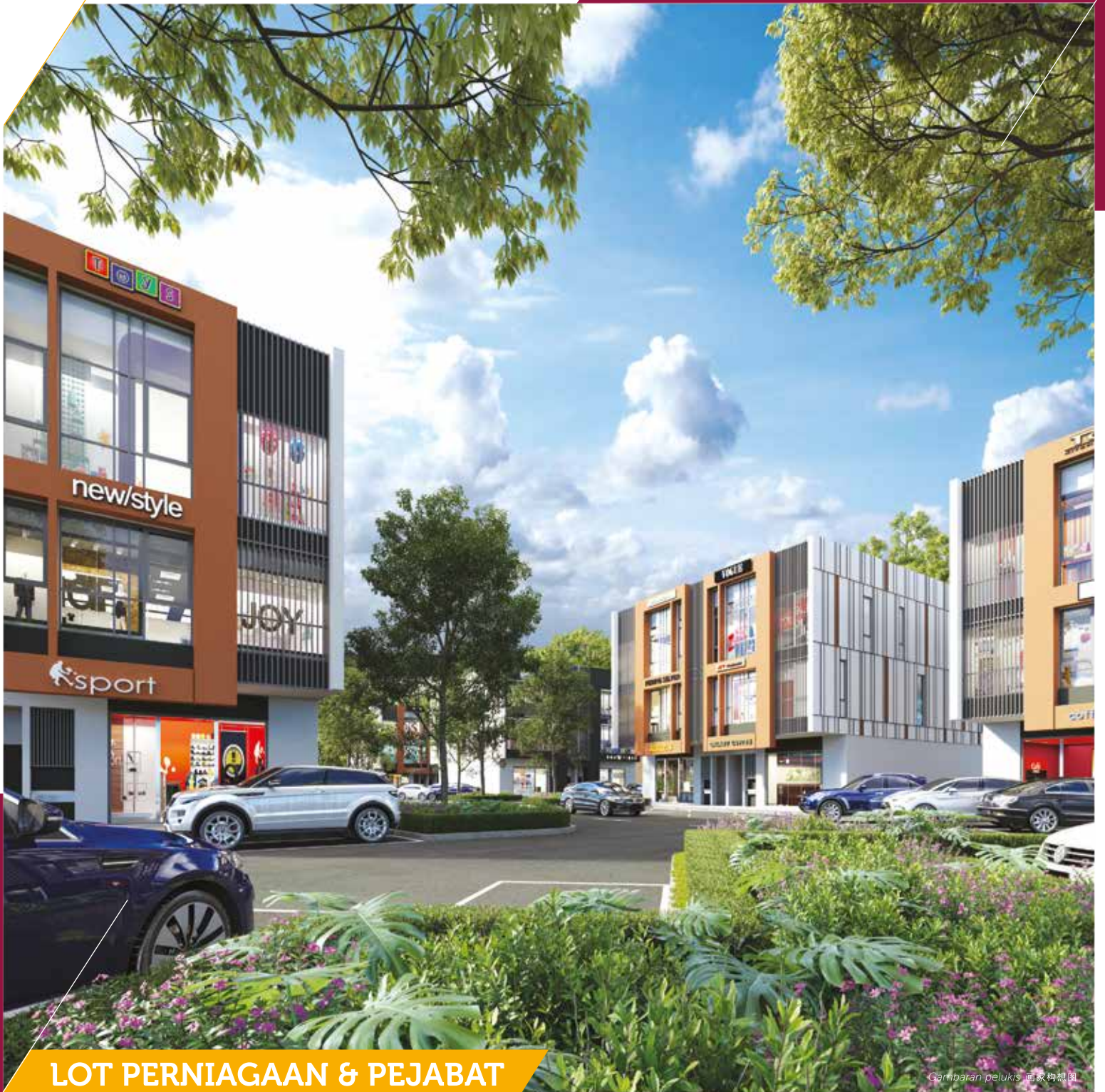
Gambaran pelukis 画家构思图